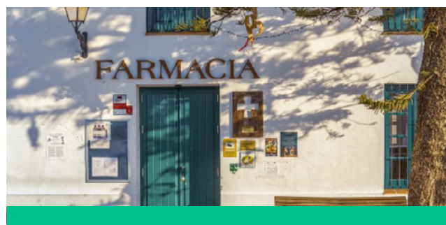
Foto de una de las 22.222 farmacias comunitarias.