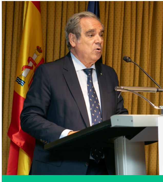
Jesús Aguilar: “Ya estamos avanzando hacia el primer pilotaje del Programa de Farmacia Comunitaria Rural”.

El acto de toma de posesión finalizó con unas palabras del presidente del Gobierno de La Rioja, Gonzalo Capellán.