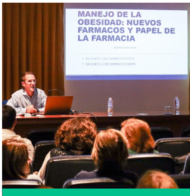
Imagen de la conferencia.

¡No te pierdas nada! Conferencias, talleres, jornadas de formación... Mantente al tanto de todas las actividades que organiza el Colegio. Todo lo que necesitas para seguir creciendo y desarrollándote en tu día a día profesional.