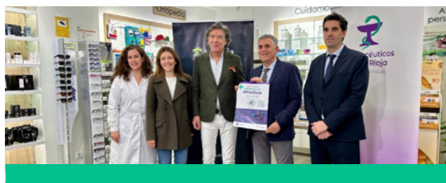
Presentación de la campaña de sensibilización en una farmacia de Logroño.