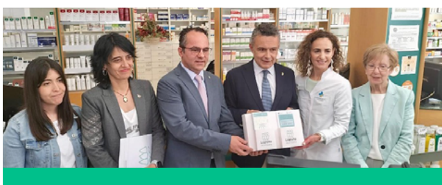
Con Conrado Escobar, alcalde de Logroño.

Cada 20 días pasan por la farmacia riojana el equivalente a toda la población de nuestra comunidad. Esta confianza nos coloca en una posición única: cada visita es una oportunidad para escuchar, acompañar y tender una mano.